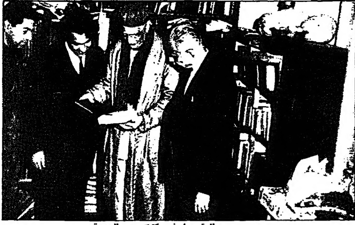
ومع العقاد في مكتبته بصر الجديفة